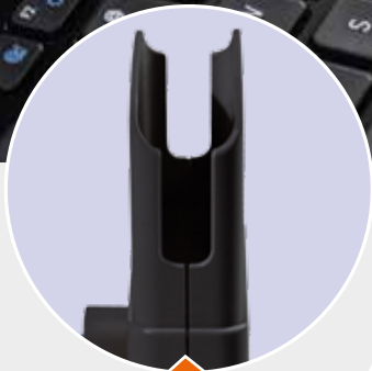
tasca con fondo gommato